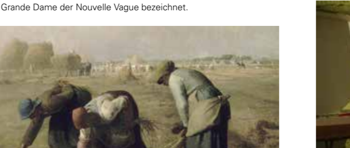
[ aus dem Film „Ich hätte lieber einen anderen Film gemacht“ (2024) von Suse Itzel ]

Agnès Varda (*1928 12019) war eine französische Filmemacherin, Fotografin und Installationskünstlerin. Sie gilt als eine der Schlüsselfiguren des modernen Films und war eine der führenden Filmemacherinnen. Von einigen Kritikern wird sie als Grande Dame der Nouvelle Vague bezeichnet.