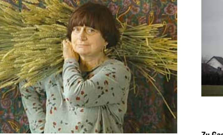
[ aus dem Film „Les glaneurs et la glaneuse“ (2000) von Agnès Varda ]