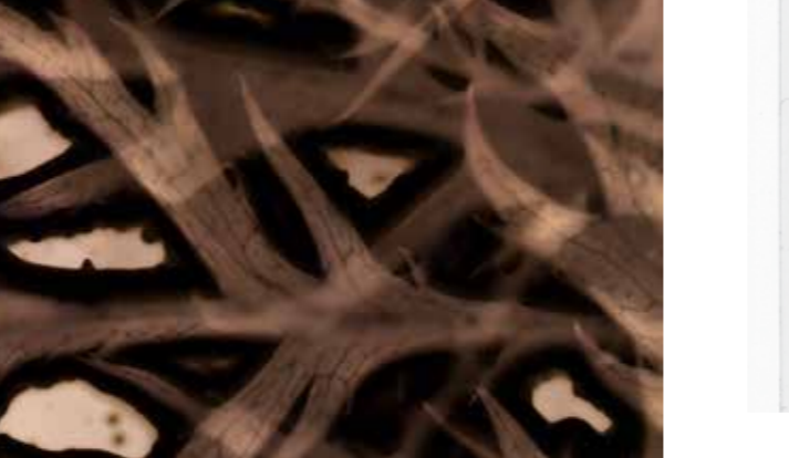
[ aus dem Film „A Perfect Storm“ (2022) von Karel Doing ]