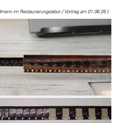
[ ein Film von Thomas Feldmann im Restaurierungslabor / Vortrag am 01.06.26 ]