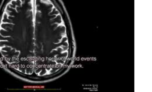
[ aus dem Film „Being John Smith“ (2024) von John Smith ]

Sammeln ist eine Leidenschaft, die Leiden schafft (aber auch viel Freude macht). Das kommt auf die Perspektive an. In diesem Programm gibt es (experimentelle) Filme aus der First-person Sammlerperspektive, aber auch (unkommentierte) Dokumentationen neutraler Beobachter. Perspektive fokussiert: Wahrnehmen und Sinngeben - letztlich auch aus der Perspektive des Zuschauers. (MB)