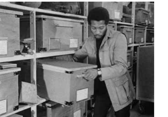
[ aus dem Film „You Hide Me“ (1970) von Nii Kwate Owoo ]

Ausführliche Informationen zu den Filmen und Programmen: https://filmklasse-hbks.de/veranstaltungen/filmforum.html