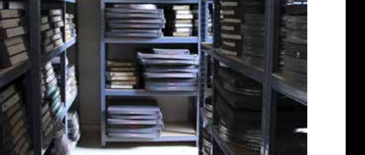
[ aus dem Film „Der Filmsammler“ (2025) von Florian Krautkrämer ]

Zu Gast am heutigen Abend: Susann Maria Hempel. Ihr Film „Die Hüter des Unrats. Eine kurze Geschichte des Abfalls“ ist Teil der Staatlichen Kunstsammlungen Dresden im ‚Archiv der Avantgarden‘. - Am morgigen Dienstag startet ihr Workshop ‚Verzicht Üben II‘.