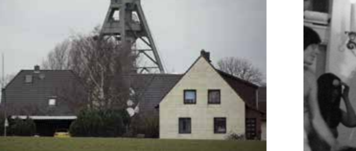
[ aus dem Film „SCHICHT“ (2015) von Alex Gerbaulet ]