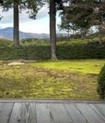
[ Entsuji Temple Kyoto nahe der Seika-Universität ]

!!- Achtung: Freitag !! Fr, 10.07.2026 | 19.00 h